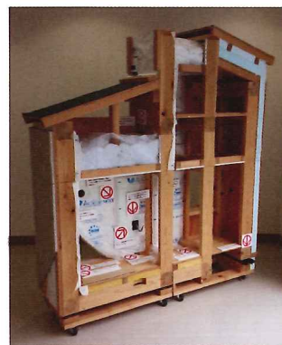
※断熱施工模型の説明はございませんが、会場に展示しておりますので自由にお写真をお撮り下さい。

※平成25年度以降の修了者が対象となりますので平成24年度の修了者は再受講が必要となります。