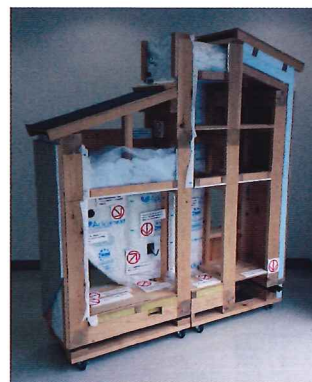
※断熱施工模型の説明はございませんが、会場に展示しておりますので自由にお写真をお撮り下さい。